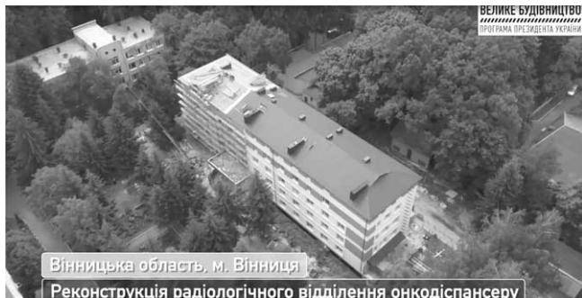
Вінницька область, м. Вінниця Реконструкція радіологічного відділення онкодиспансеру