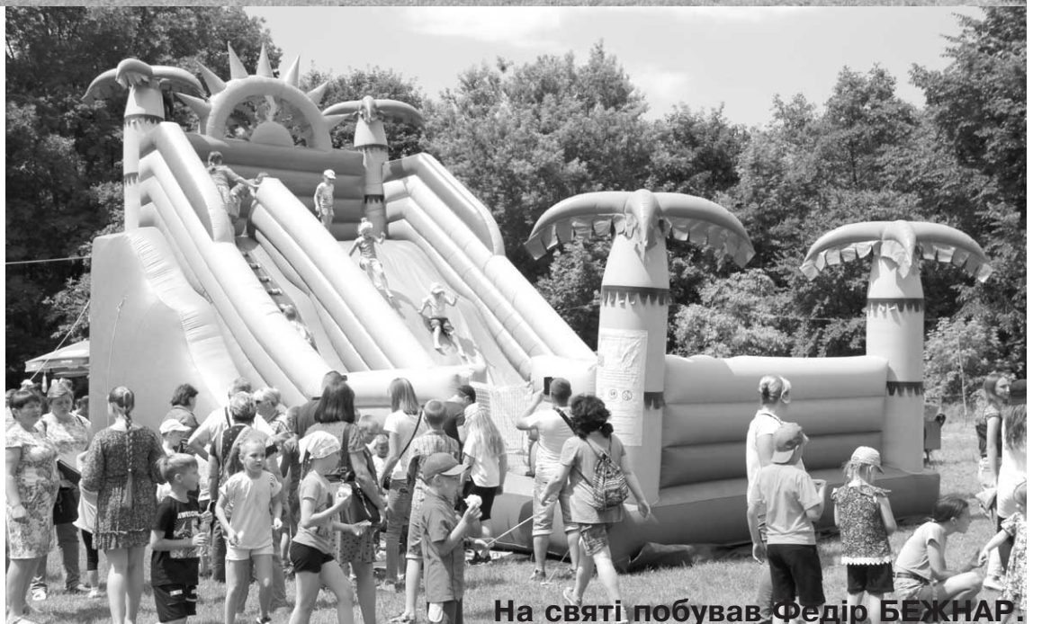
На святі побував Федір БЕЖНАР.