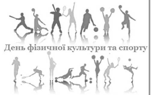
День фізичної культури та спорту

Проте хочу зауважити, що в нашій громаді місцева влада не