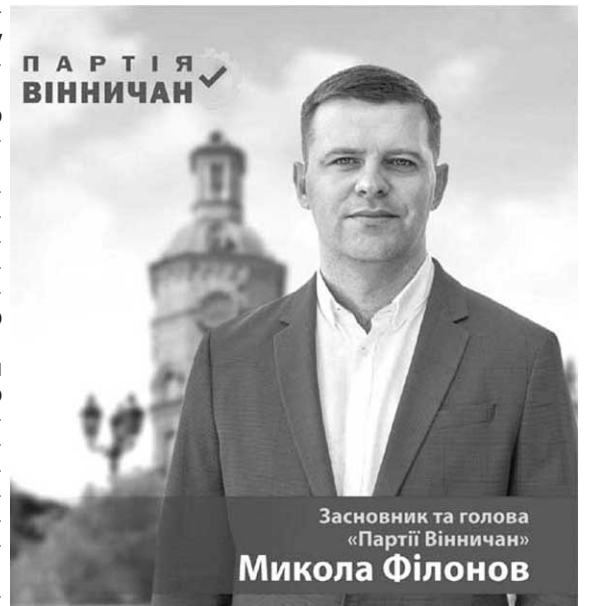
Засновник та голова «Партії Вінничан»

Наступним кроком після створення таких мегарегіонів буде посилення намірів місцевих управителів, у руках