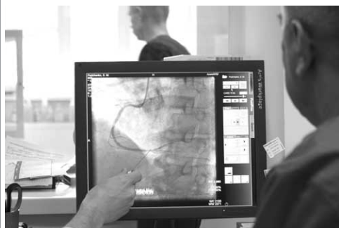
Планова коронарографія - майже безболісна процедура, що виконується під місцевою анестезією.

Матеріал виготовлено в межах реалізації субпроекту «Складова розвитку системи охорони здоров'я Вінницької області, направлена на покращення медичної допомоги хворим із серцево-судинною патологією».