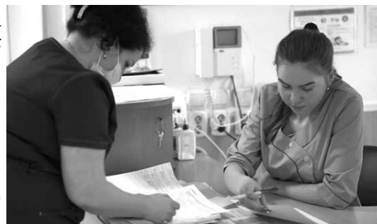
Планове стентування може попередити інфаркт міокарда.

Перше стентування у світі було виконане ще у 1988 році. Вінниця почала активно використовувати цей метод 2008-го року, коли у регіональному