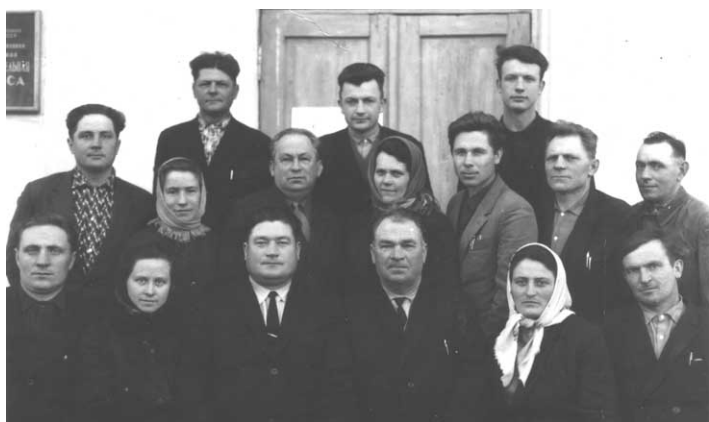
Правління колгоспу с.Безимене, третій зліва, заступник голови колгоспу

P.S. 18 березня 2014 року ветеран пішов у вічність. 1-го вересня 2020 р. йому виповнилося б 95 років.