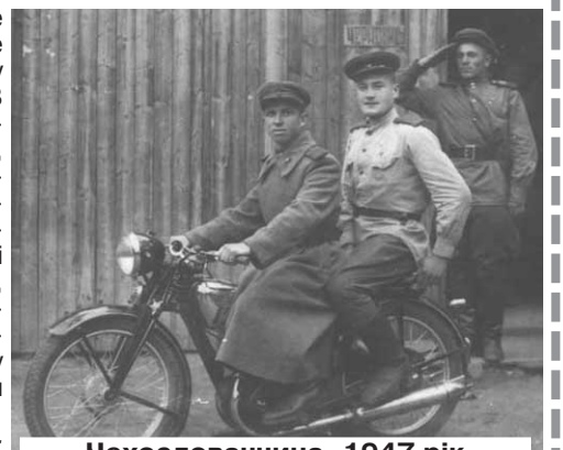
Чехословаччина, 1947 рік

- Я воював і проходив подальшу службу і рядовим, і сержантом, і старшиною. В