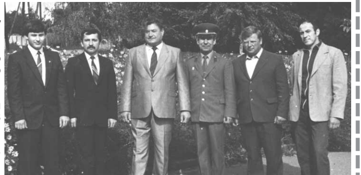
В центрі, третій зліва, директор Безименської середньої школи, 1986 рік

- В 1988 році я пішов на пенсію і почав писати вірші. А в 1999 році видав збірку «Деякі теми на перебудові і проблеми» (Гумор, сатира, щирі вітання та добрі побажання). В цій збірці 5 розділів: «І так почалась нова в нас перебудова», «Жменька сміху друзям на втіху», «Кілька думок в жанрі байок», «Про біду незрівнянну, про війну Вітчизняну», «Щирі вітання і добрі побажання».