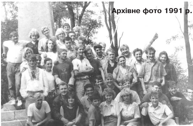
Архівне фото 1991 р.