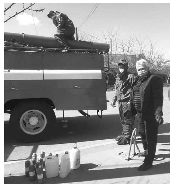
За матеріалами Вінницької РДА.

Шановні жителі району! Бережіть себе та своїх близьких!