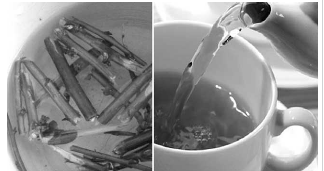
Підготувала Людмила ДЖЕДЖУЛА.

Не зайвим буде насущити дікі груші та яблука і періодично готувати з них чай, а не тільки узвар на Святвечір. Такий напій буде корисний особливо тим людям, котрі мають проблеми з нирками. До такого напюю варто додати квітку чорнобривця, тоді він набуде особливої користі – допоможе людям із подагрою.