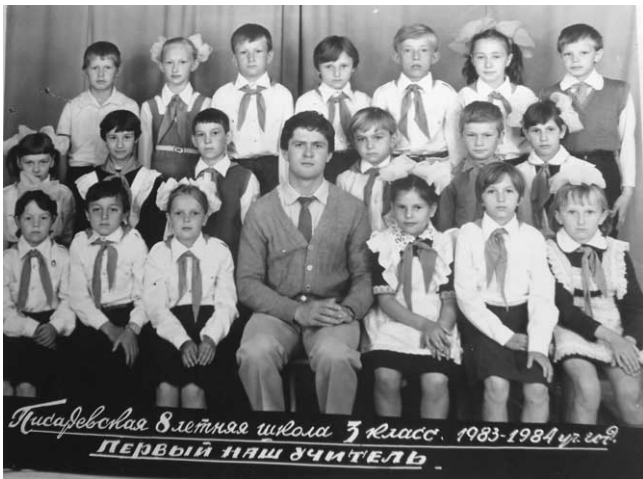
Писарівська 8-летняя школа 3 класс. 1983-1984 уч. год. Первый наш учитель

Особливим і неповторним в цьому році для мене, вчителя з великим педагогічним стажем є 30-ти літній ювілей шкільного випуску. Таке дуже рідко трапляється в шкільній педагогічній практиці. Мені випала особлива честь бути в