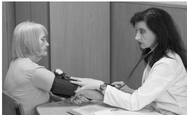
Вимірюйте артеріальний тиск щоразу, як відвідуєте лікаря.

У нормі зниження артеріального тиску та частоти пульсу у здорової людини відбувається вночі. Якщо ж режим сну порушено або Ви регулярно працюєте у нічні зміни, організм не встигає повноцінно розслабитися. Денний сон не дає рівнозначного ефекту. Тривале нервово збуд-