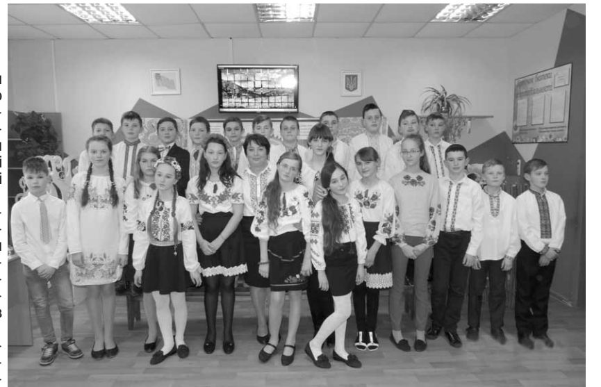
рою та надією. І де б ми не були, скрізь відчувати поклик рідної землі та родинне тепло!