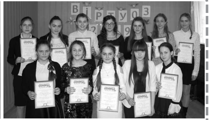
ДМШ - 2 уч., Лука-Мелешківська ДМШ - 6 уч., Стрижавська ДМШ - 18 уч.

У ньому взяли участь учні інструментальних класів 4-х ПСМНЗ Вінницького району. Всього 37 осіб: Вінницька районна ДМШ - 11 уч., Вороновицька