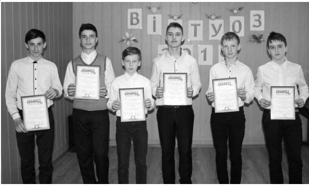
26 березня в музичній світлиці Стрижавської ДМШ відбувся районний конкурс «Юний віртуоз-2019».

У рамках цього свята в Оленівському НВК:ЗОШ І-ІІІ ст. - ДНЗ двадцять другого березня відбувся вечір пам'яті юної вінницької поетеси Олександри Бурбело, члена Національної спілки письменників України. Організувала й провела захід бібліотекар Навчально-виховного комплексу