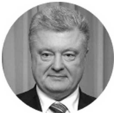
Петро ПОРОШЕНКО 15.95% - 3 013 367 (У Вінницькій області 22.37%)