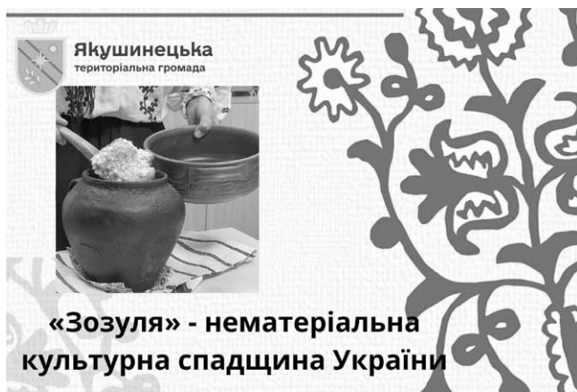
«Зозуля» - нематеріальна культурна спадщина України

В січні 2023 року за результатами конкурсу "Фуд-гід Україною" від Євгена Клопотенка, який був покликаний віднайти унікальні українські страви, "зозуля" була внесена у спеціальну кулінарну книгу серед 30 найкращих рецептів.